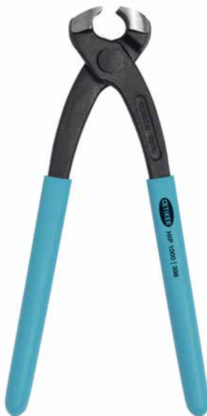
Клещи одинарного действия * НІР 1000 | 396 № для заказа 14100396

Инструменты одинарного действия: превосходная прочность и высокое усилие зажатия + экономичный дизайн