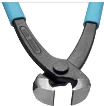
HIP 1000 | 396