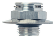
皿ばねワッシャー付きアルミニウム製QC

FKM (-40°C~205°C)、優れた耐オゾン性および耐熱老化性 AEM (-40°C~180°C)、優れた耐油性、耐グリース性